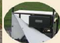
Auch mit Kühlschublade

Das untere Fahrgestell des WerbeAnhängers besteht aus massiven Provielen, die schwer genug sind, um ein umkippen des WerbeAnhängers bei Windböhe zu verhindern. Die Ladefläche des Anhängers bietet Platz für zwei kleine oder eine große Normkiste. Vier stabile Stützen sorgen dafür das der Anhänger auch in abgekoppelten Zustand einen sicheren halt hat . Zwischen den oberen Werbeschild und das Fahrgestell befindet sich eine schnell Kupplung ,so das der Werbe Anhänger platzsparend untergebracht werden kann.